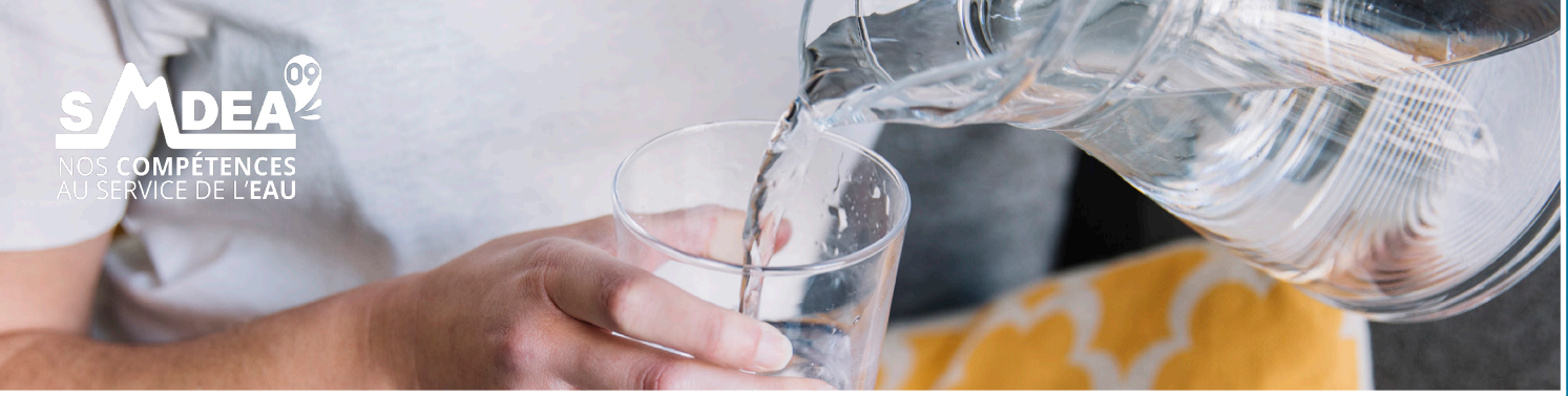
SCHÉMA PUBLIC DISTRIBUTION EAU POTABLE

Le SMDEA vient d'adopter le schéma public de distribution d'eau potable de votre commune, en concertation avec la Mairie de Saurat et les services de l'Etat. Ce schéma délimite les zones desservies par le réseau de distribution et donc, les zones dans lesquelles le SMDEA est tenu d'assurer le service public de distribution d'eau potable.